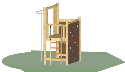
Lezecká souprava 2